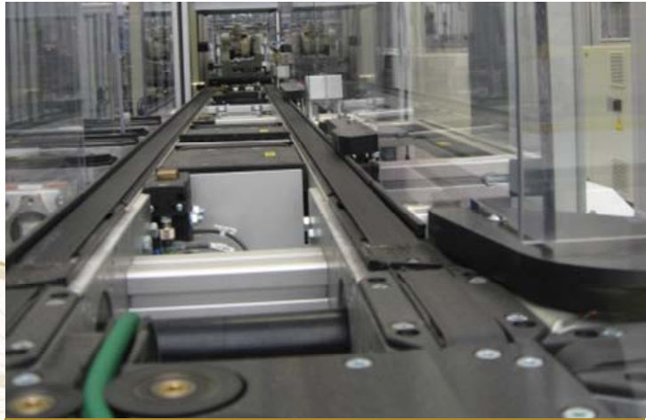
SCHNELLES RÜSTEN (QCO / SMED)