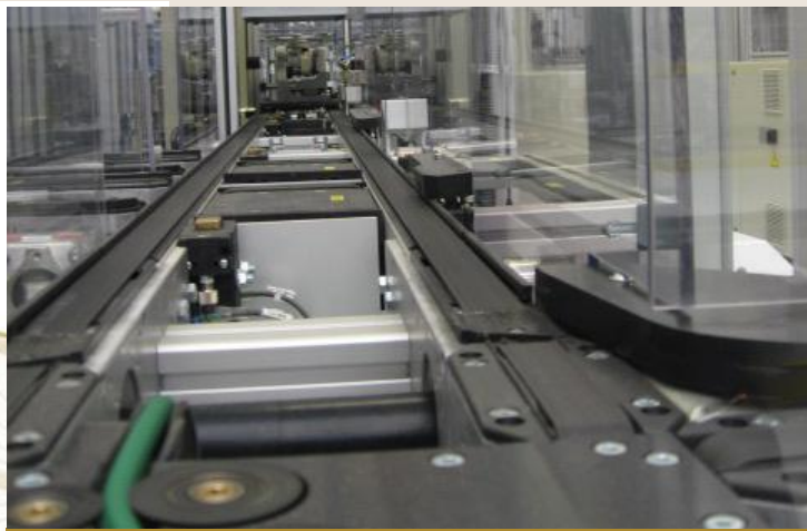
5S UND VISUELLE FABRIK